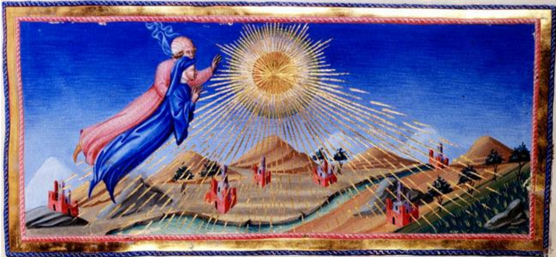
Giovanni di Paolo (1403-1482), 4ª Esfera Planetária (Sol Céu): Dante e Beatriz voando no Céu de Vénus em direcção ao Sol Céu ( Paradiso X ).