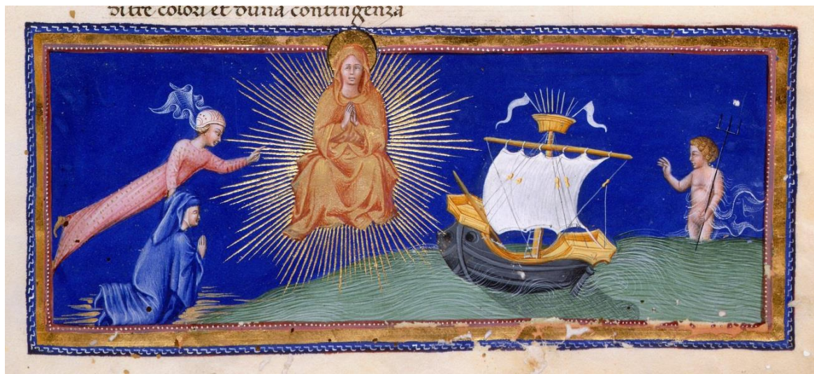
Giovanni di Paolo (1403-1482), Paraiso , Beatriz a assistir Dante ajoelhado em oração por uma viagem segura, enquanto o navio está na água