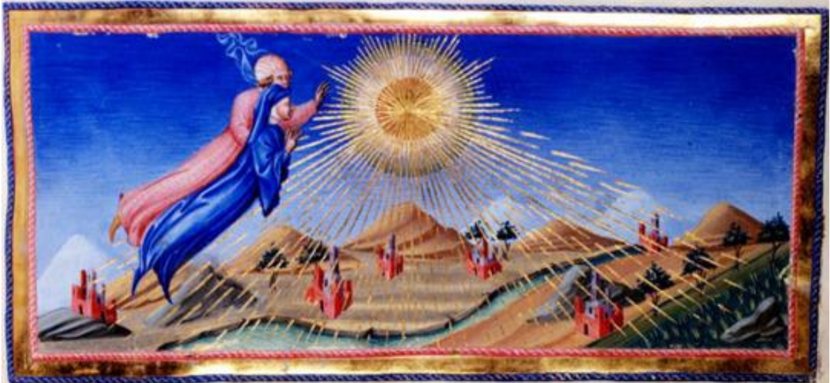
Giovanni di Paolo, Paraíso , Canto X, Dante e Beatrice ascendem ao céu do Sol (c. 1450)