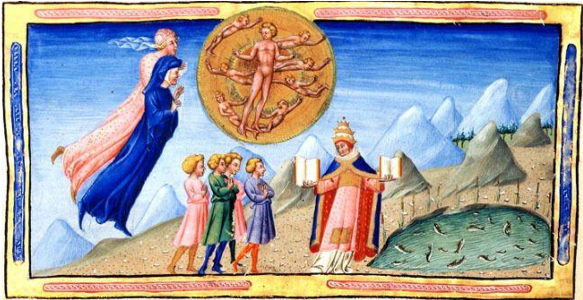
Giovanni di Paolo, Dante e Beatrice sobem ao Paraíso de Mercúrio (c.1450)