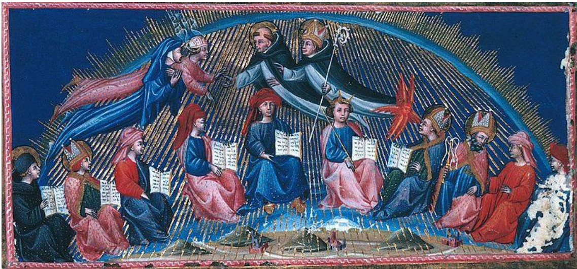
Giovanni di Paolo (1403-1482) - Paraíso , canto X, primeiro círculo dos 12 mestres da sabedoria liderados por Tomás de Aquino